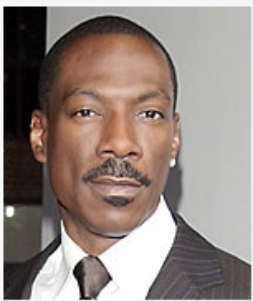
Did Eddie Murphy Really Die?

About Zen five-star h remarkabl picturesqu snowfalls t